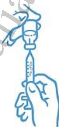
Figura 6: rimuovere le bolle d'aria e riempire di nuovo la siringa