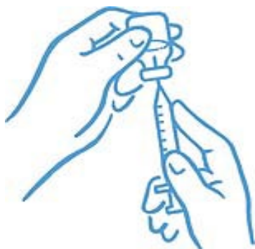
Figura 4: punta nel liquido