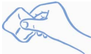
Figura B: premere (non sfregare) con garza o batuffolo di cotone