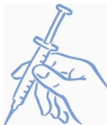
Figura 7: pronto per l'iniezione