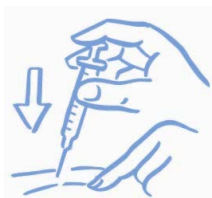
Figura A: pizzicare leggermente la cute ed iniettare come indicato dal medico